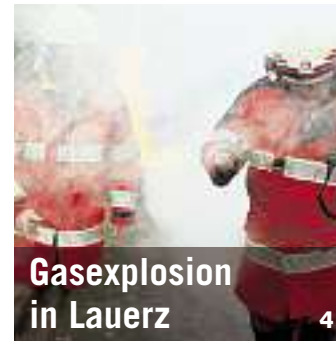
Gasexplosion in Lauerz 4

Inserate/Anzeigen: Fon 041 819 08 08 Fax 041 819 08 17 inserate@bote.ch