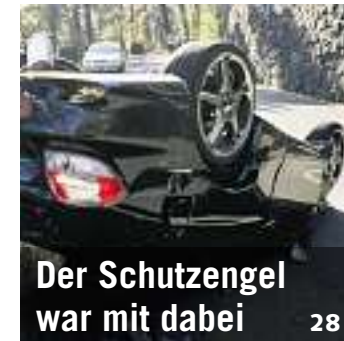
Der Schutzengel war mit dabei 28