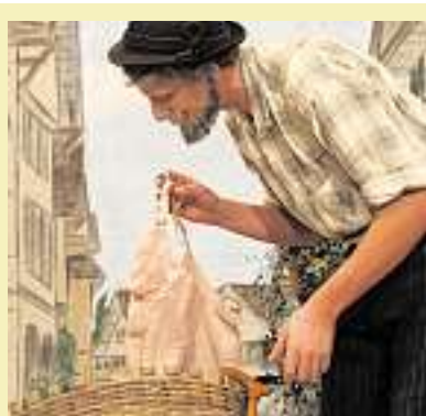
Küssnacht: Das Landjugend-Theater feierte am Samstag Premiere.