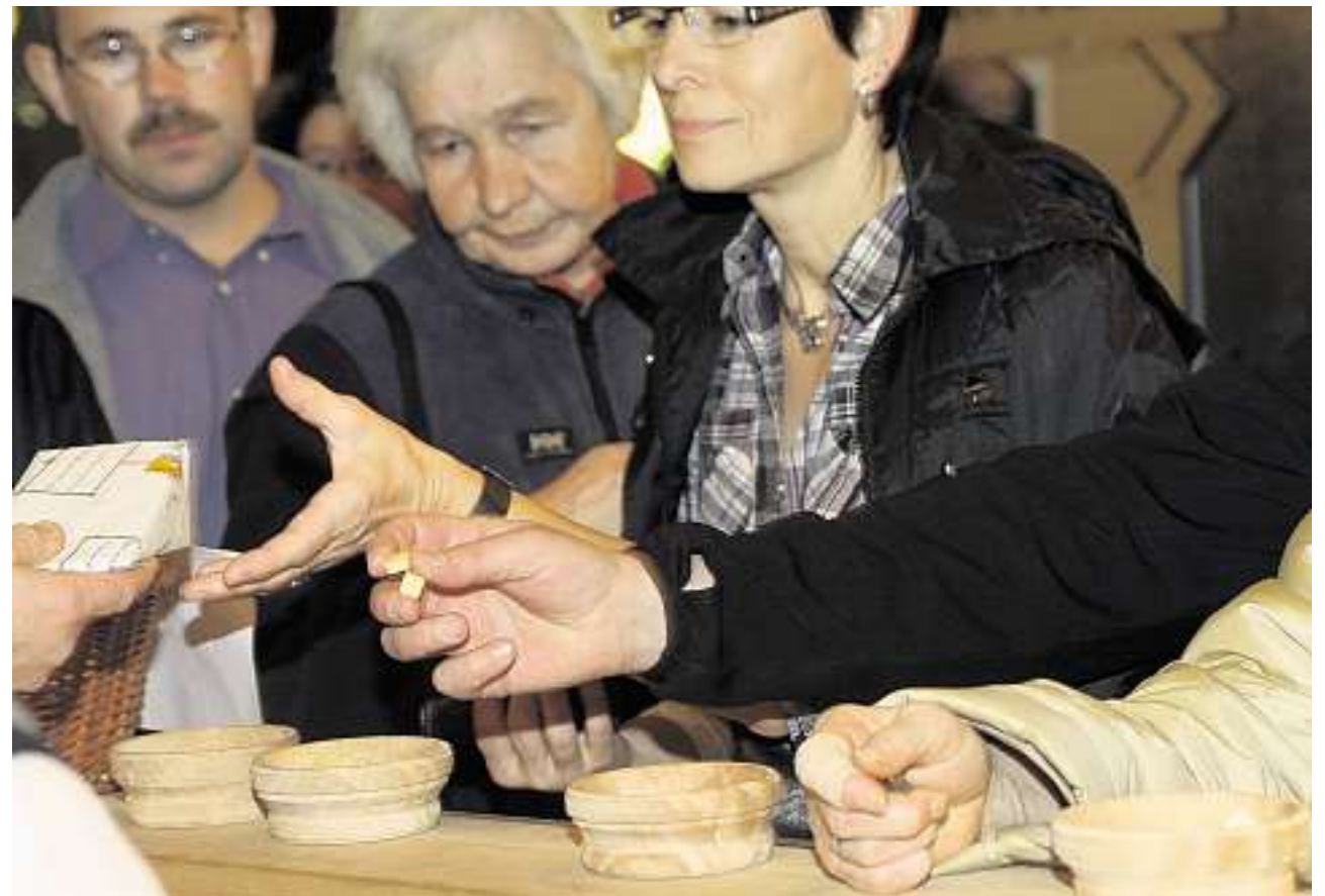
Reger Handel: Am Alpchäsmärcht wechselte manches Stück Käse den Besitzer.