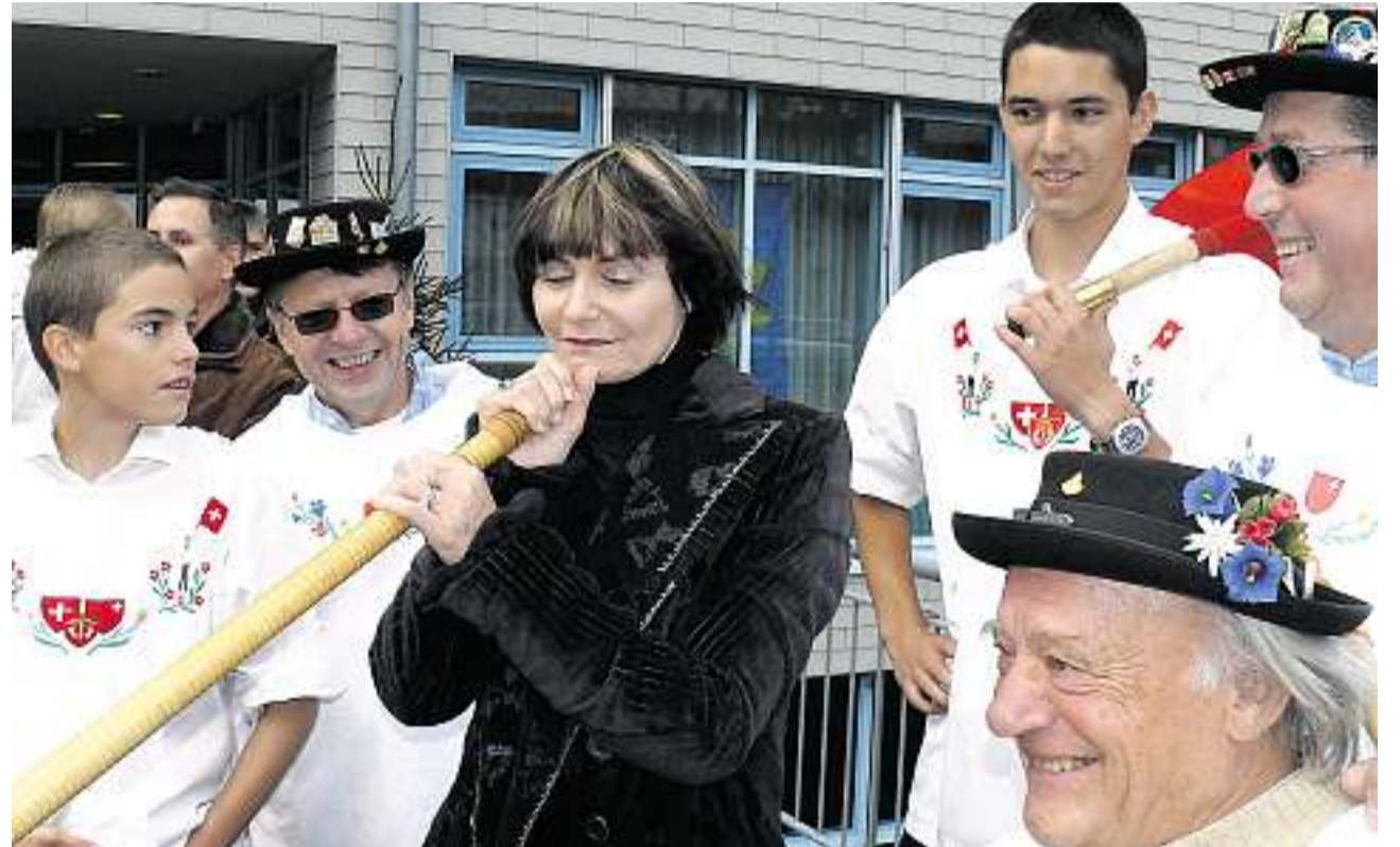
Bundespräsidentin Micheline Calmy-Rey fühlte sich wohl im Muotatal: Die hohe Magistratin griff gar zum Alp horn, was die Interpreten und Besucher freute.

Das Muotatal wurde auch diesmal regelrecht von Besuchern «überflutet».