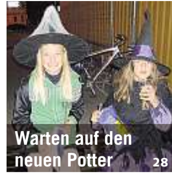
Warten auf den neuen Potter 28